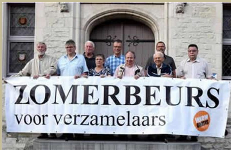
Het organiserende Zomerbeurscomité op de pui van de Lakenhal

Eitjes dragen naar de Karmelietessen om goed weer af te smeken helpt echt!! Het was de 2e keer dat de initiatiefnemers van de Zomerbeurs voor Verzamelaars deze heugelijke vaststelling konden maken. De aan-wezigheid van 60 standhouders van allerlei pluimage, een 400-tal bezoekers, een unieke tentoonstelling van flessenscheepjes en een goed-lopende organisatie maakten het geheel tot een aanwinst in de verzamel- beurskalender. Proficiat aan alle deelnemers, organisatoren en helpers!