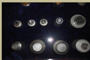
Koninklijke munt van België

enkele sfeerbeelden (klik foto voor grotere afbeeldingen)