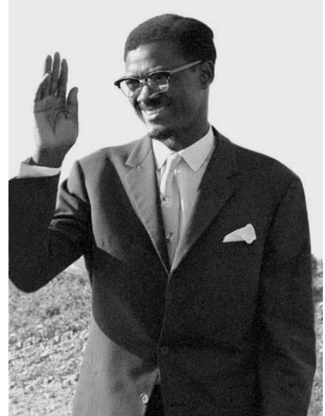
Patrice Emery Lumumba (1925-1961)