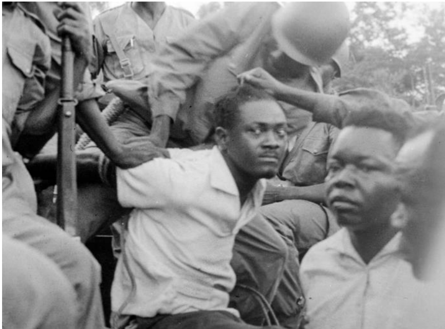
Lumumba werd gevangengenomen door de troepen van Mobutu, december 1960