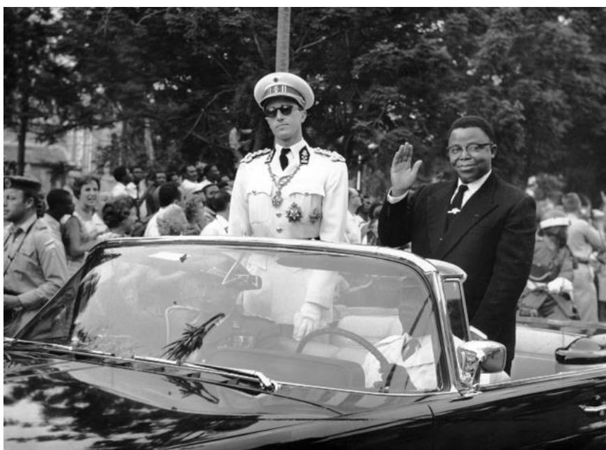
Koning Boudewijn en president Kasa-Vubu tijdens de triomfantelijke optocht van 30 juni 1960