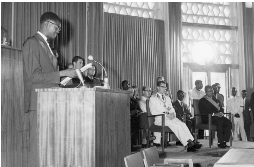
Speech van Patrice Lumumba op 30 juni 1960, koning Boudewijn luistert

Joseph Kasa-Vubu werd president van Congo en Patrice Lumumba eerste minister, twee rivalen uit verschillende politieke partijen, waartussen het niet boterde. Lumumba predikte het unitarisme, waardoor de rijkdommen van de welstellende provincies ook de rest van Congo ten goede zouden komen, en toonde zich voorstander van verregaande sociale hervormingen. Hij geloofde dat er welvaart kon komen, mits de Belgen maar buiten te gooien en alles in eigen handen te nemen. Eigenlijk was dit totaal onrealistisch, want daar waren nauwelijks lokale mensen voor opgeleid. Dat alles schoot in het verkeerde keelgat bij vele westerse landen, en hij werd als communist afgeschilderd en tegengewerkt. Al in de eerste weken na de onafhankelijkheid staakte de Force Publique (het leger en tegelijk politie), die wilde dat de Belgische officieren eruit gegooid werden. De zwarten keerden zich tegen de blanken en er waren moordpartijen en verkrachtingen. Een grote exodus van de Belgen kwam op gang.