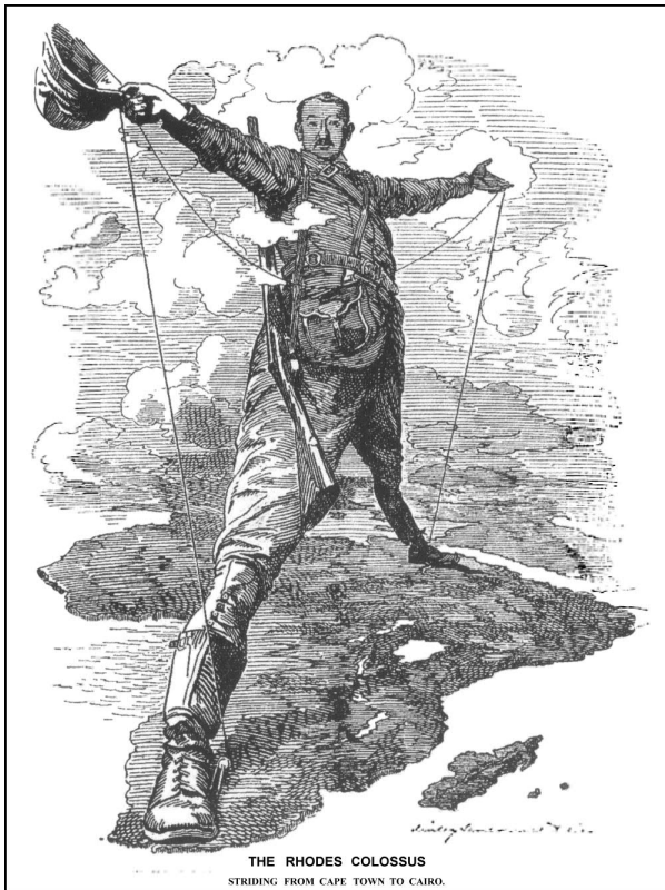
Spotprent in het Engelse tijdschrift Punch uit 1892 over Cecil Rhodes' droom: de spoorweg van Kaapstad tot Cairo

spoorverbinding aan te leggen tussen Kaapstad en Cairo, uiteraard alles over Brits gecontroleerd grondgebied (deze spoorweg werd later grotendeels gerealiseerd; alleen het deel Soedan-Oeganda ontbreekt vandaag nog).