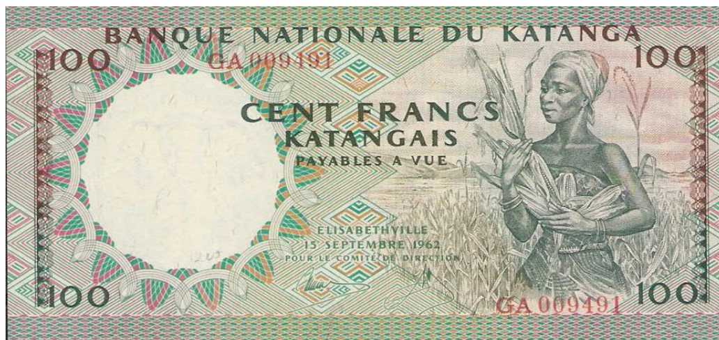
100 frank Katanga, 136 x 65 mm, tweede serie 1962, gedrukt door Johan Enschede en Zonen, Nederland

Lumumba reageerde op de afscheiding door hulp te vragen aan de Verenigde Naties (VN) die de afscheiding veroordeelde en een vredesmacht stuurde. België moest van de VN zijn troepen terugtrekken, want ze werden beschouwd als agressors. Midden in de Koude Oorlog kreeg Lumumba van Rusland ook vliegtuigen ter beschikking om zijn troepen te verplaatsen in Congo. Ondertussen was de rivaliteit tussen Kasavubu en Lumumba tot een breekpunt gekomen en werd Lumumba ontslagen. Lumumba vluchtte naar Stanleystad en vormde er een eigen regering, maar werd er door de troepen van Mobutu, ondertussen opperbevelhebber van het leger, gevangengenomen. Lumumba werd overgebracht naar Katanga waar hij werd vermoord in duistere omstandigheden. Ook Dag Hammarskjöld, de secretaris-generaal van de VN, kwam bij het conflict om het leven: zijn vliegtuig stortte neer in Noord-Rhodesië (vandaag Zambia) in 1961 na een missie in Katanga, waarschijnlijk een aanslag.