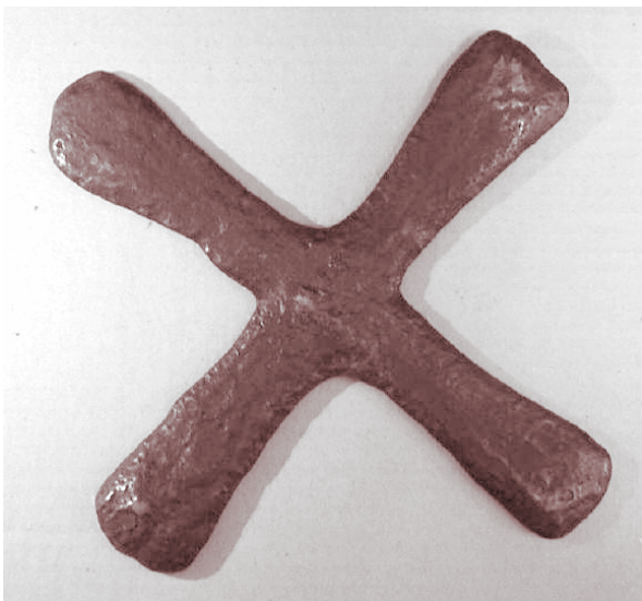
Katangakruis, 18 cm diagonaal

Leopold II begreep dat de enige manier om de Engelsen te verslaan erin bestond hen voor voldongen feiten te plaatsen en stuurde dan maar zelf vier expedities naar Katanga in de periode 1890-93 met de bedoeling van Katanga effectief te bezetten, verdragen af te sluiten en bedrijven op te richten. De eerste expeditie was onder leiding van de Belgische luitenant Paul Le Marinel, die als opdracht had militaire posten op te richten aan de oostgrens van Katanga teneinde de dreiging van de Arabische slavenhandelaars tegen te gaan. Hij was daarmee de eerste Belg die ooit een voet zette in Katanga in 1891. De tweede en derde expedities waren handelsmissies die georganiseerd werden door de Compagnie du Congo pour le Commerce et l'Industrie en door de Vrijstaat zelf. De vierde expeditie werd georganiseerd door de Compagnie du Katanga en stond onder leiding van de Canadese genieofficier William Stairs die Bunkeya bereikte in december 1891. Msiri weigerde echter zich te onderwerpen aan de Vrijstaat en na ellenlange onderhandelingen werd hij in een vuurgevecht doodgeschoten door een van de expeditieleiders, de Antwerpenaar Omer Bodson, die daarbij zelf ook omkwam. Katanga werd dan opgedeeld onder een aantal lokale chefs en onderworpen aan de Vrijstaat.