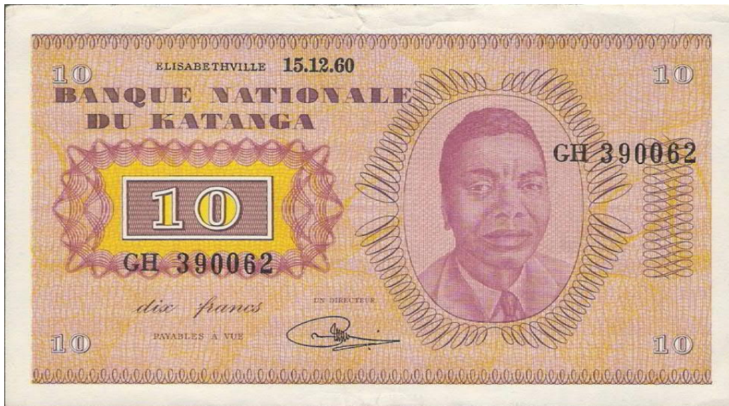
10 frank Katanga met portret van Tshombe, 137 x 76 mm, eerste serie 1960, gedrukt door Roto-Sadag SA, Zwitserland

bestonden uit een koperen 1 F en 5 F, alsook een gouden afslag van de 5 F.