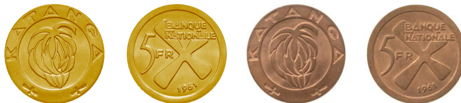
5 frank goud en 5 frank koper Katanga 1961

De bankbiljetten werden in omloop gebracht in januari 1961 en de 5 frank in juli of augustus 1961, aan een koers van 1 Katangese frank = 1 Congolese frank = 1 BEF. De gouden 5 F werd uitgedeeld aan de genodigden bij de eerste verjaardag van de Nationale Bank van Katanga in hotel Leopold II te Elisabethstad op 8 augustus 1961. Dat luxueuze hotel bestaat nog steeds en heet nu hotel Park. De gouden 5 F werd ook op de vrije markt aangeboden aan 20 USD (= 1000 BEF destijds) om de staatskas een beetje te spijzen. De gouden munten dienden ook om er de huurlingen mee te betalen.