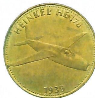
Heinkel - 1939