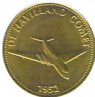
Havilland Comet - 1952