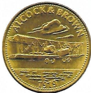
Alcock & Brown - 1919

De set wil de verovering van de ruimte, doorheen de geschiedenis, in beeld brengen. Terwijl in sommige landen sets circuleerden met 20 penningen, ontvingen andere landen slechts 16 penningen, 4 stuks werden opzettelijk achtergehouden om de klanten toch maar zoveel mogelijk te laten terugkeren om te tanken. De muntjes (26mm) werden uitgevoerd in zowel brons als aluminium en in een ronde en een 12-hoekige versie.