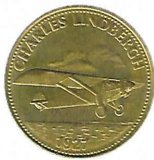
Charles Lindberg 1927