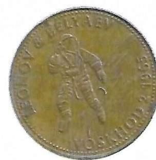
Voskhod 2 - 1965