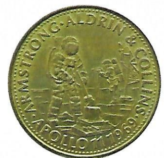
Apollo 11 - 1969