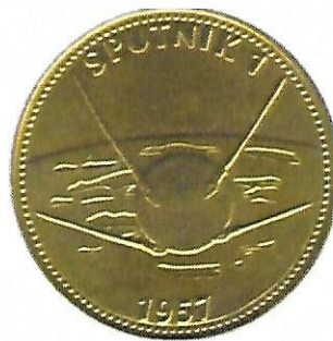
Spoetnik 1 - 1957