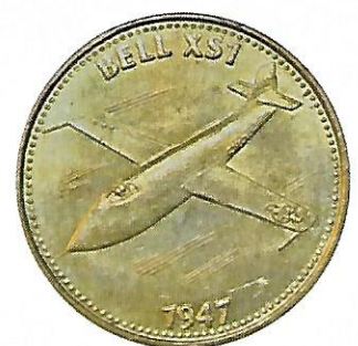
Bell XS1 - 1947