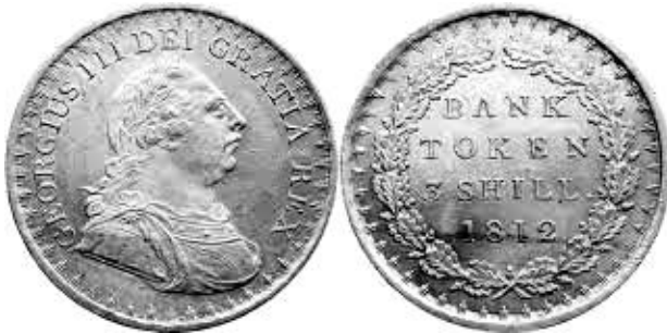
Bank token 3 shilling 1812

De overgang naar de 'token' zilveren munten begon in 1811 toen de Bank of England voor de circulatie 3s.- en 1s. 6d.-tokens sloeg. Privéaanmunting van dit tekengeld in de jaren 1788-1795 en 1811-1815 hielp om het tekort aan koninklijke munten te verlichten.