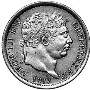
Shilling 1817 vz

Verdediger van het Geloof, in het Latijn Fidei Defensor, is een titel die in diverse vormen door koningen wordt gedragen, zeker door de Britse. Tot op de dag van vandaag.