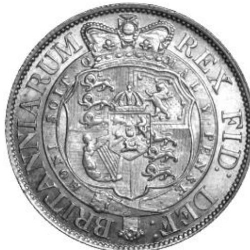
Halfcrown 1817 kz

De Orde van de Kousenband (The most noble Order of the Garter) werd in 1348 ingesteld door Eduard III, 26 Knights, koning en koningin inbegrepen. Haar