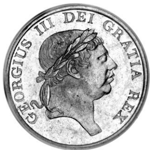
3 Shillings Bank token 1812 vz