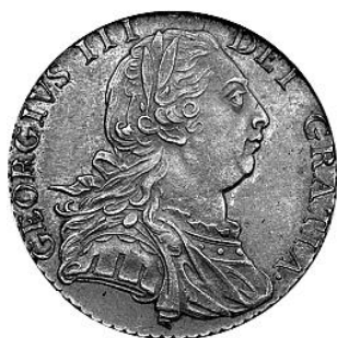
Shilling 1798 vz

In de naam van koning George, nl. in de Latijnse schrijfwijze ervan, werd voor onze klinker 'U' nu eens een V en dan weer een U gebruikt. De Latijnse 'V' had vroeger zowel een vocalische (klinker-) als een consonantische (medeklinker-) waarde. Deze letter heeft, evenals de letter F en de Griekse letter Ypsilon (Y, u) de Semitische wâw als oorsprong. De Etrusken vereenvoudigden de letter tot V. De Etruskische klankwaarde was /u/, maar omdat het Latijn geen letter voor /w/ kende, gebruikten de Romeinen de V voor zowel de medeklinker /w/ als de klinker /u/. Bijvoorbeeld het woord via (Latijn voor "weg") werd door hen uitgesproken als wie-aa. Pas in de middeleeuwen kwam onze 'U' erbij.