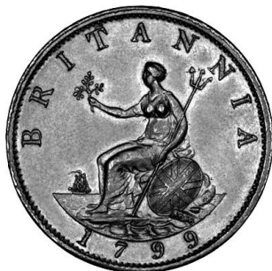
Halfpenny 1799 kz

munten zouden we wel eens moeten terugkeren naar de afbeelding van Athena (( Παλλάς Ἀθηνᾶ), de Griekse godin. Zij is in de Griekse oudheid vooral bekend als de godin van de wijsheid en godin van de kunst. Daarnaast wordt ze vaak als godin van de krijgskunst en vrede aangezien. Zij is – om het zo te zeggen – het rolmodel van veel sterke vrouwen, die de eigenschappen en kenmerken van een natie verpersoonlijken.