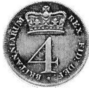
Fourpence 1818 kz