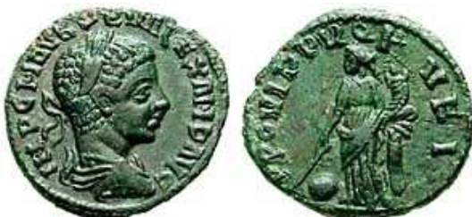
Severus Alexander, populaire 'limes-keizer'