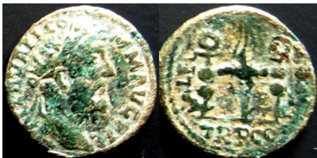
Severus Alexander, populaire 'limes-keizer'