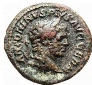
Gordianus I, zeer zeldzame limes-denarius