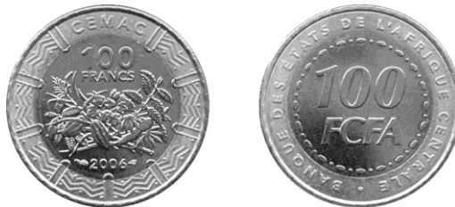
100 CFA-frank 2006 bimetaal, Centraal-Afrikaanse Staten, voorzijde: cacaoplant met vruchten