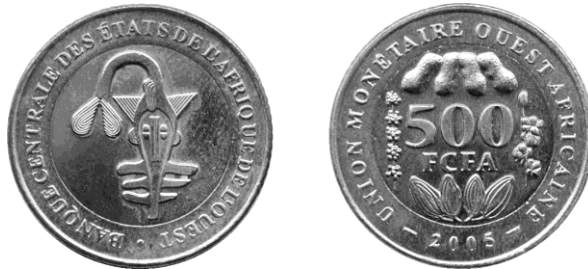
500 CFA-frank 2005 bimetaal, West-Afrikaanse Staten, voorzijde: Ashanti-gewicht in de vorm van een vis; keerzijde: pinda's (boven), cacaovruchten (onder), koffie (links), katoen (rechts)

Na een devaluatie van de Franse frank op 17 oktober 1948 werd de waarde 2 Franse franken. Met de introductie van de nieuwe Franse frank op 1 januari 1960 werd de CFA-frank 0,02 nieuwe frank waard (1 nieuwe frank was namelijk 100 oude franken waard). Op 12 januari 1994 werd de CFA-frank opnieuw gedevalueerd en was nog maar 0,01 Franse frank waard. Met de komst van de euro werd 1 CFA-frank 0,00152449 euro waard. Omgekeerd is 1 euro dus 655,957 CFA-franken waard.