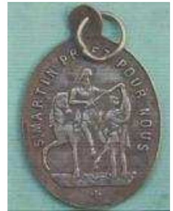
Franse penning met manteldeling 'Martin priez pour nous'

Mensen helpen en geld, de link is vlug gelegd. Tot ver over de Franse landsgrenzen heen is zijn legende verteld. Honderden kerken en parochies werden naar hem genoemd, in binnen- en buitenland. Ook in verre en vreemde landen werden munten met zijn beeltenis geslagen: daalders, dukaten, gulden, thalers, scudo's, enz. Vele stukken waren in zilver, de meest gezochte zijn zeldzame gouden munten.