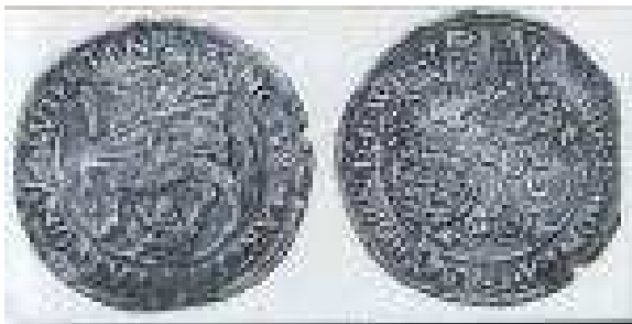
Zilveren sint-Martinusdaalder, 27.08 gram, 40 mm Graafschap horne, Filips van Montmorency (1540-1588) Geslagen te Weert ca. 1560 vz – St-Maarten te paard, zijn mantel delend met bedelaar PATRONUS WIERTEN SANCTUS MARTIN kz – gehelmde wapenschilden van Montmorency en Horne HORN D.D. WIERT Ph ... Bar D MORIM Cab

Mensen helpen en geld, de link is vlug gelegd. Tot ver over de Franse landsgrenzen heen is zijn legende verteld. Honderden kerken en parochies werden naar hem genoemd, in binnen- en buitenland. Ook in verre en vreemde landen werden munten met zijn beeltenis geslagen: daalders, dukaten, gulden, thalers, scudo's, enz. Vele stukken waren in zilver, de meest gezochte zijn zeldzame gouden munten.