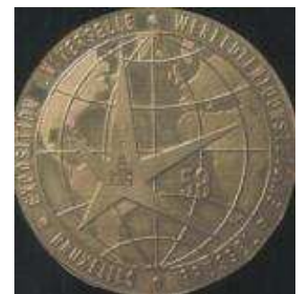
gouden herdenkingsmedaille Wereldtentoonstelling Brussel 1958