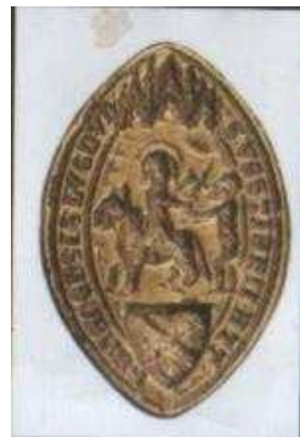
ovale zegelplaat LVGDVN = Lugdunum

De historiek over sint-Martinus heeft niets te maken met numismatiek. Het verwonderde me dan ook dat er in de voorbije eeuwen echte munten zijn geslagen waarop onze heilige werd afgebeeld. Meestal zijn het geen alledaagse munten, maar stukken waarvoor nu een geïnteresseerde en gepassioneerde verzamelaar diep in zijn geldbeugel moet tasten. Niet de numismatieke geschiedenis, noch de zeldzaamheid of waarde van deze stukken primeert voor mij, maar wel de artistieke schoonheid van sint-Martinus' beeltenis. Vaak gaan natuurlijk de twee samen. Ik kan geen studie opzetten over sint-Maarten in de numismatiek, daarvoor heb ik veel te weinig ervaring in de wereld van penningen en munten.