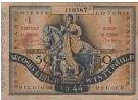
Winterhulp : biljet van 50 frank (1944) bruine kleur, ontwerp van R. Warnotte

Wat je hier ziet zijn natuurlijk maar een miniem aantal munten, medailles en penningen uit de enorme aantallen die wereldwijd moeten bestaan. Het kleine aanbod en vooral mijn niet te grote financiële middelen zijn natuurlijk de voornaamste oorzaken van de beperktheid van deze kleine verzameling.