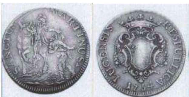
zilveren scudo 1754, Lucca, Italië

Kun je me nog aan items helpen over St-Martinus ? Ik zou je zeer dankbaar zijn !