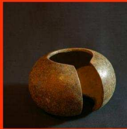
Enkelring van de Mbole (Kongo)

De banden werden vooral als bruidsschat gebruikt.