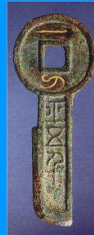
China van gereedschap tot munt