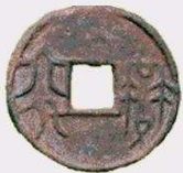
Ronde munt (met vierkant gat) uit de Zhou-dynastie; De primitieve karakters duiden de waarde aan.

Deze vorm zou meer dan tweeduizend jaar het kenmerk zijn van de haast alle Chinese munten