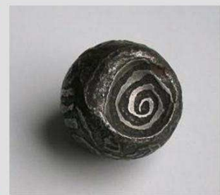
Kogelgeld van Portugees Malacca versierd kogelschroot uit 17 e eeuw