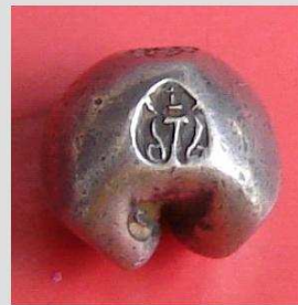
Tical, Phot-duang oude Thaise munt Siam 1851 - 1861