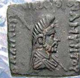
Amyntas, 95 – 90 vC