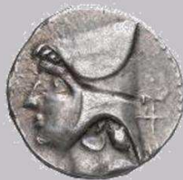
Arsaces II, 211 – 191 vC Vz – hoofd met bashlik en diadeem Kz – koninklijke boogschutter naar rechts ΑΡΣΑΚΟΥ

Rond 250 v. Chr. veroverde Arsaces I het gebied van Parthië en verklaarde het onafhankelijk van de Seleuciden.