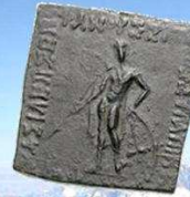
Strato I, 125 – 110 vC