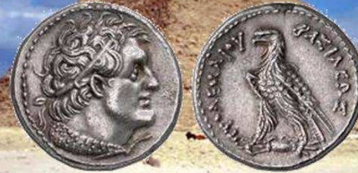
Ptolemaios V Epiphanes, 204 – 183 vC zilveren tetradrachme geslagen in Alexandria ΒΑΣΙΛΕΥΣ ΠΤΟΛΕΜΑΙΟΥ

De dynastie van Ptolemaios I Soter, gewezen generaal van Alexander de Grote, heeft 3 eeuwen over Egypte geregeerd. Zij heeft de pracht en praal van de Hellenistische beschaving in het land der Farao's geïntroduceerd. Met Cleopatra's dood in 30 vC stert dit Griekse koningshuis aan de Nijl uit.