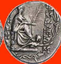
Tyche, stadsgodin van Antiochia, houdt een palmtwigg, riviergod Orontes aan haar voeten