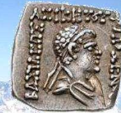
Philoxenos, 100 – 95 vC