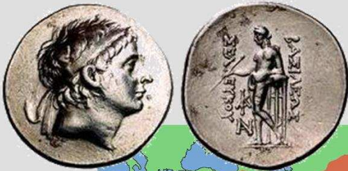
Seleucos II Callinicus 246 -226 vC tetradrachme Ateller: Sardes

hellenistische dynastie in het huidige Syrië, 311 – 63 vC