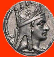
Tigranes II de Grote, 95 - 56 vC met Armeense tiara

Het zelfstandige koninkrijk Armenië bereikte de grootste bloei onder Tigranes II, uit de dynastie van de Artaxiden.