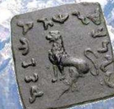
Menander, 90 – 85 vC