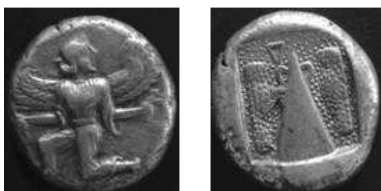
Caunos (Carië), 460-400 vC. zilveren stater, 11.69 g vz – gevleugelde Nike, geknield kz – heilige steen tussen 2 ‘vogels’

Caunos , een maritieme stad aan de Klein-Aziatische kust tegenover Rhodos, werd gesticht door kolonisten van Kreta.