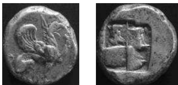
Teos (Ionië), 520-505 vC zilver stater, 12.03 g vz – griffioen (fabeldier) met geheven voorpoot en gekrulde vleugels kz – 4-delige incuse

Teos een kuststad in Klein-Azië, noordwest van Efese, werd rond 544 vC, toen de Perzen over Ionië domineerden, door haar inwoners verlaten. Zij migreerden naar Thracië waar ze Abderea stichtten. Na een paar jaar keerden vele inwoners terug naar de moederstad om van Teos een welvarende stad te maken, dit duurde tot aan de komst van de Romeinen.