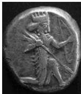
Siglos, type IIIa (5.33 g) Darius I, 500-485 vC