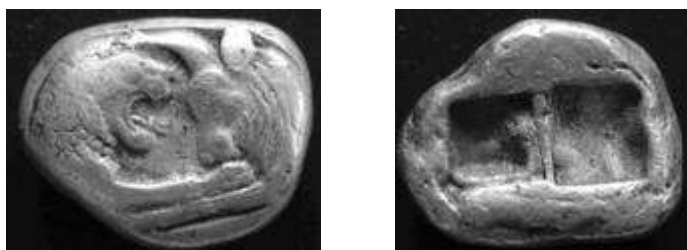
Lydië , koning Croesus, 550-520 vC zilver stater / dubbele sikkels, 10.68 g vz – leeuw (l) tegenover stier (r) kz – dubbele incuse

De Creiseide, zilveren munt van Croesus, toont de leeuw (koning) tegenover een stier (inferieure opponent)