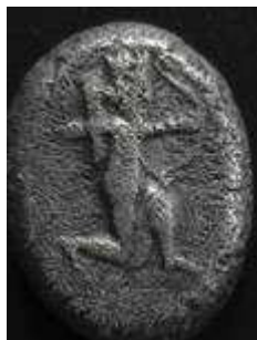
Siglos, type II (4.93 g) Darius I, 500-485 vC