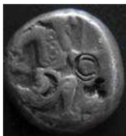
Siglos type IV Artaxerxes I – Darius III 450-330 vC