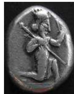
Siglos, type IIIb (5.32 g) Xerxes, 485-470 vC