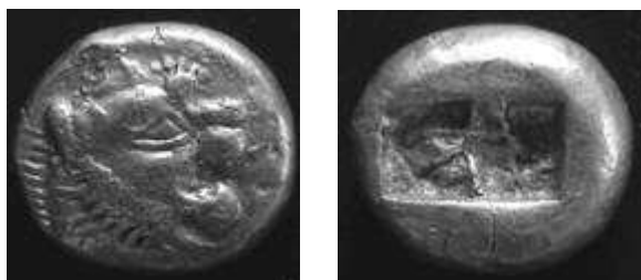
Lydië , 650-610 vC 1/3 Electrum stater, 4.72 g vz – leeuwenhoofd met ‘neuswrat’ - kz – dubbele incuse

De geschiedenis geeft koning Kroesus van Lydië de eer om als eerste het gebruik van munten, in de vorm zoals wij ze nu kennen, te hebben geïntroduceerd. Hij plaatst een eigen zegel op de munten die garant staan voor het juiste gewicht aan edelmetaal en kwaliteit.