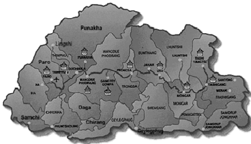
Landkaart Bhutan

Het koninkrijk Bhutan is gelegen in het Himalayagebergte en is omgeven door Tibet (de Chinezen noemen dit de “ autonome regio Xizang ”), Indië (de provincies Sikkim, West-Bengalen, Assam en Arunachal Pradesh). Bhutan heeft een oppervlakte van 46.500 Km 2 waarvan 70% bebost is en heeft een aantal bergen boven de 7000meter ( Kulha Gangri: 7554m, Chomo Lhari: 7314m )