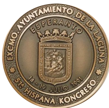
Dubbelzijdige medaille 1991