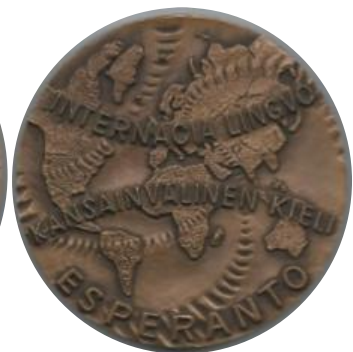
Herinnering aan bekende esperantisten