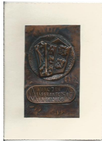
Enkelzijdige plaquette op karton gehecht