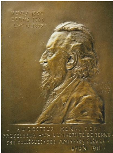
Dubbelzijdige plaquette 1911