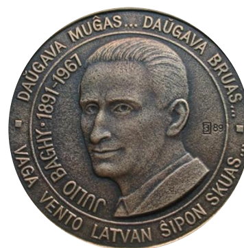
Enkelzijdige medaille 1989