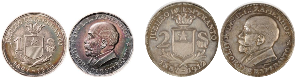
Bijzonder zeldzame betaalpenningen uit 1912

Meer dan 130 jaar zijn voorbijgegaan sinds het lanceren van de internationale hulptaal Esperanto, waarmee de initiatiefnemer, L.L. Zamenhof, de relaties tussen mensen van verschillende populaties wilde versoepelen om hen te stimuleren om in vreedevolle harmonie samen te leven. Omstreeks 1907, na nauwelijks 20 jaar, ontstond reeds bij de gebruikers van de taal de wens om een internationaal valutastelsel te ontwerpen om commerciële doelstellingen en problemen bij het wisselen van geld tussen esperantisten en de rest van de wereld te vergemakkelijken en ook om handelaars te overtuigen van de voordelen van een universele taal en een universeel valutastelsel.