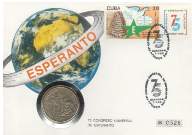
Wellicht de 1ste numisbrief in de Esperanto-numismatiek en -filatelie 1990