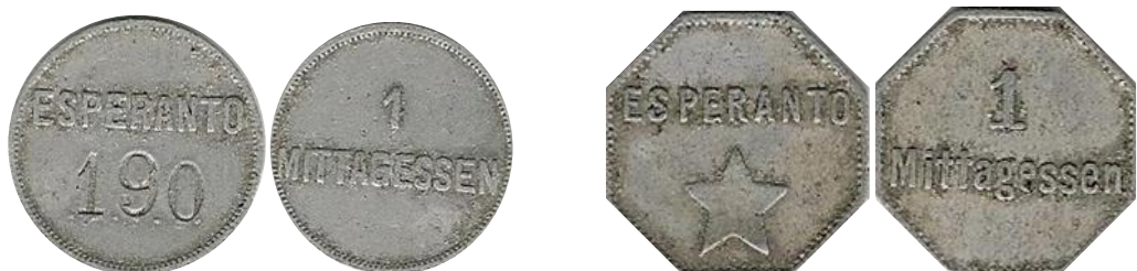
Maaltijdjetons in medailleslag, gebruikt tijdens een wereldcongres