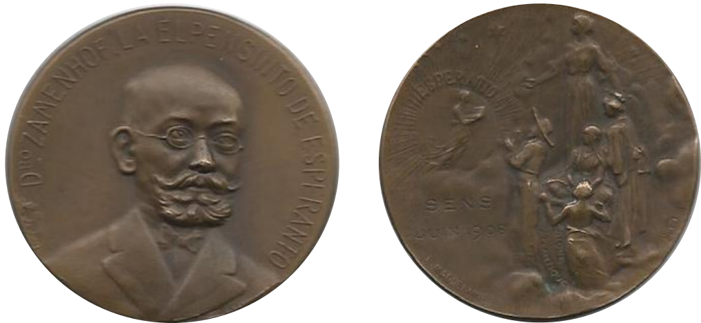
Propaganda via verheerlijking van het Esperanto-ideaal