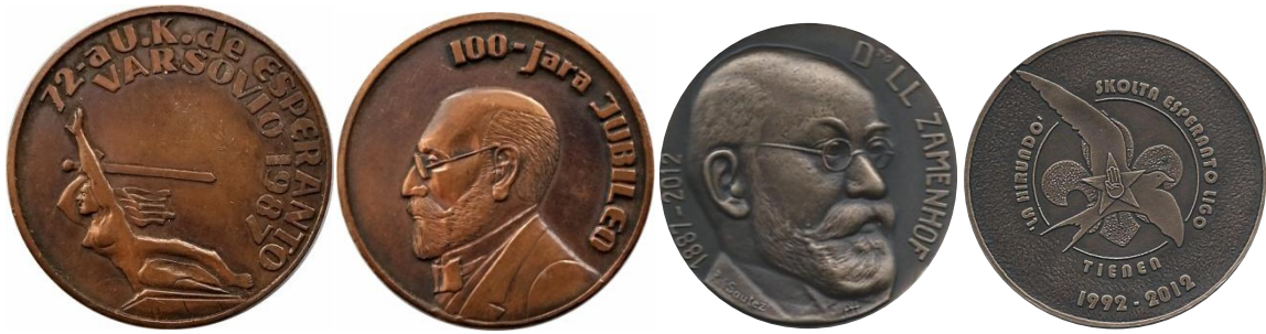
Herinnering aan bijzondere gebeurtenissen